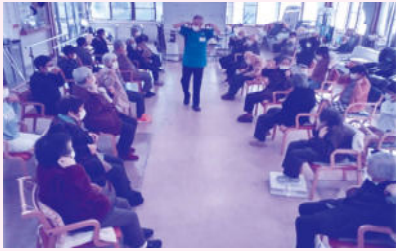
12月10日(火) 美郷南学園6年生の皆さんとの交流

12月10日(火)に介護職の勉強のため美郷南学園6年生の生徒の皆さんが来所し、利用者さまと一緒に体操やゲームをしました。また、12月12日(木)には医大の実習生の方が来所し利用者さまと制作(正月飾り)を行いました。