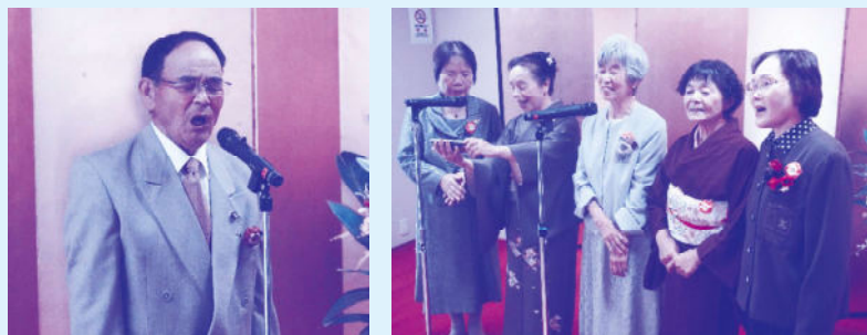
祝宴でお祝いの唄を熱唱していただきました♪