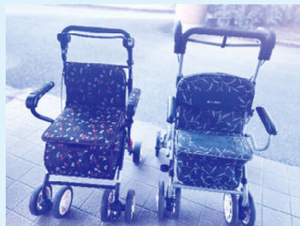
ご寄贈いただいた歩行器