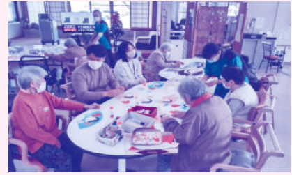
12月12日(木) 医大の実習生との交流